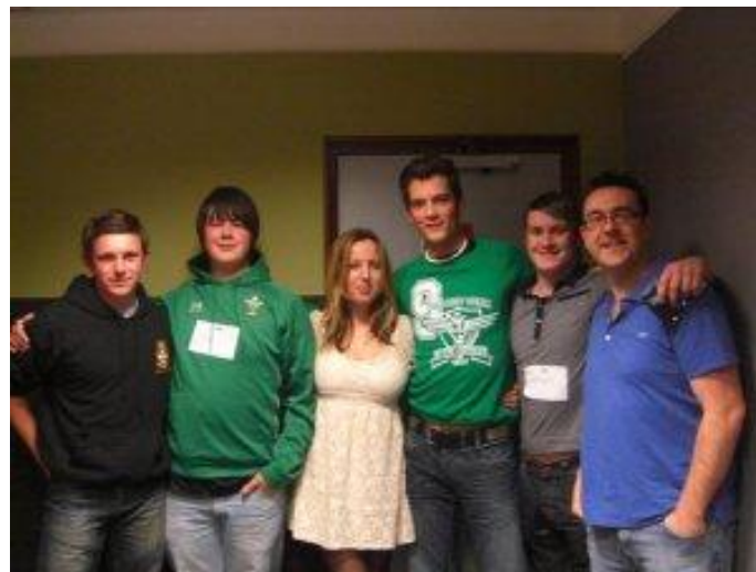
Stiwdio C2 – Radio Cymru

Yn dilyn nawdd oddi wrth Fwrdd yr Iaith Gymraeg, bu Swyddog Maes Menter Iaith Castell-nedd Port Talbot yn cydweithio gyda staff a disgyblion Ysgol Gyfun Ystalyfera er mwyn creu gorsaf radio ag e-gylchgrawn i'r ysgol. Mae'r orsaf yn darlledu rhaglenni Cymraeg am awr y dydd i'r neuadd, ffreutur a lolfar chweched. Mae'r orsaf wedi cyflwyno cerddoriaeth Gymraeg i nifer o ddisgyblion yr ysgol ac mae hefyd wedi rhoi hwb i statws yr iaith. Mis Chwefror aethom a chriw Radio Gwifren Ysgol Ystalyfera i stiwdio'r BBC yng Nghaerdydd i gyfarfod sêr rhaglen ieuenctid Radio Cymru C2, Glyn Wise a Maggi Dodd. Cafodd pob disgybl gyfle i siarad ar y radio gyda rhai'n darllen y bwletin newyddion ac yn darllen siart C2 ac eraill yn cael eu holi'n fyw ar yr awyr.